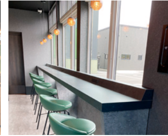
③ 待合室カウンター (コンセント、USBあり)