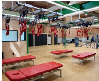
⑨ リハビリコーナー

メタボリックシンドロームとは、内臓肥満に加えて「脂質異常」、「高血糖」、「高血圧」が組み合わさることによって、心臓病や脳卒中などになりやすい病態のことを言います。薬物療法や生活指導のほか運動処方箋に従って運動療法を行います。